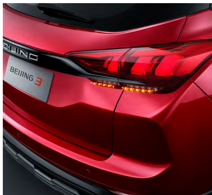
System sygnalizacji awaryjnego hamowania