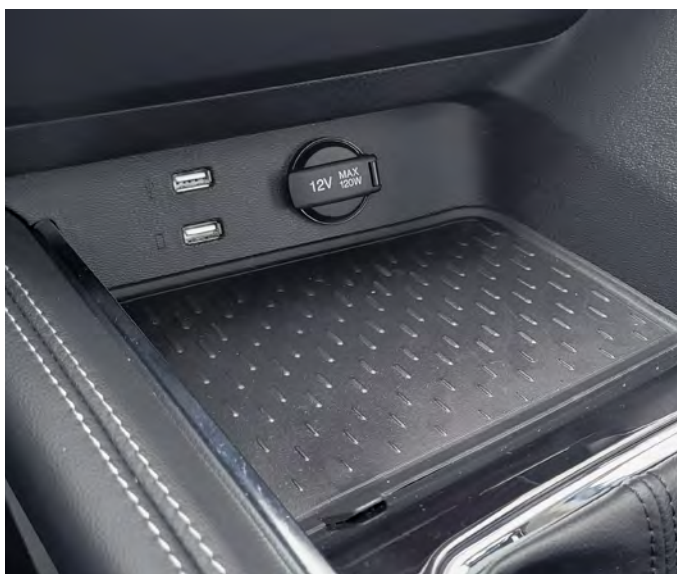
Dwa porty USB z funkcją ładowania z przodu + port USB z tyłu