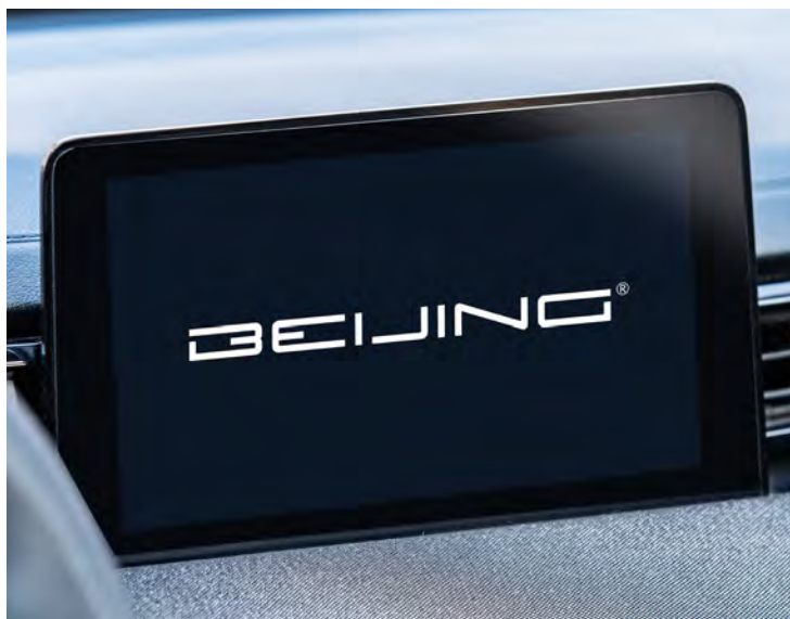
8-calowy multimedialny ekran dotykowy