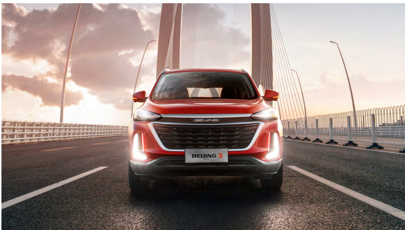
Światła dzienne LED