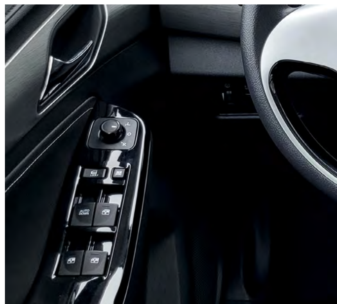
Lusterka zewnętrzne regulowane elektrycznie