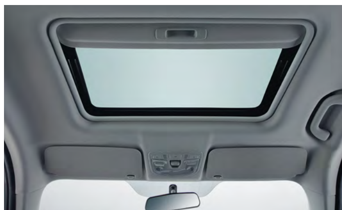
Okno dachowe sterowane elektrycznie