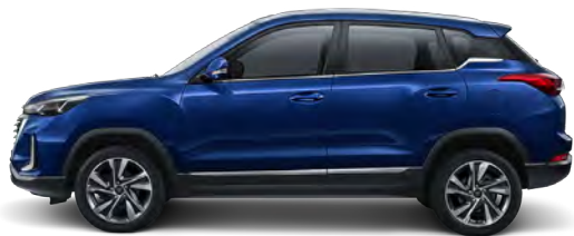
Niebieski metalizowany 31B1