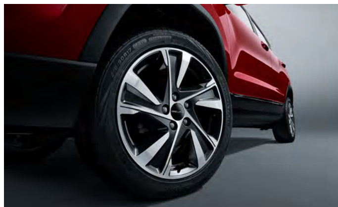
17-calowe obręcze kół ze stopu aluminium