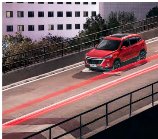
System wspomagania nagłego hamowania EBA