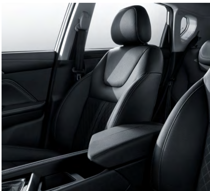
4-kierunkowa regulacja fotela pasażera