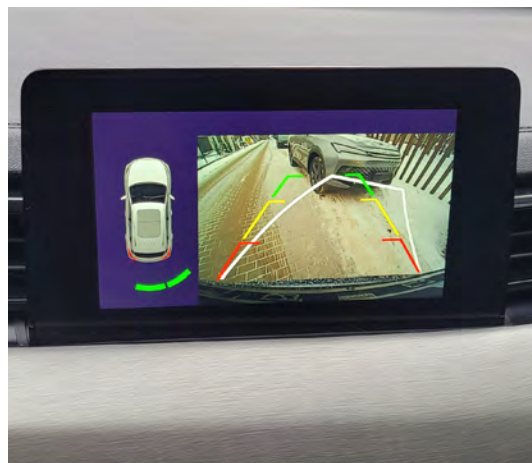
Kamera cofania z dynamicznymi liniami pomocniczymi