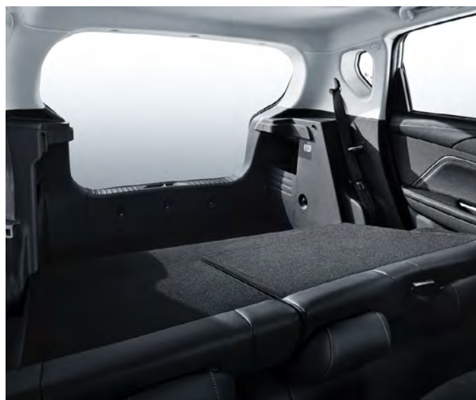
Tylne siedzenie składane w proporcji 40/60