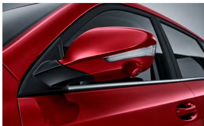
Lusterka zewnętrzne z kierunkowskazami