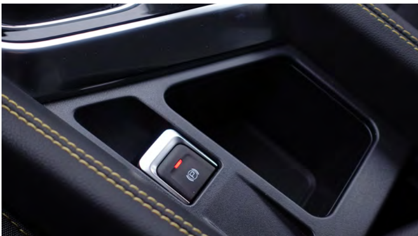
Elektryczny hamulec postojowy