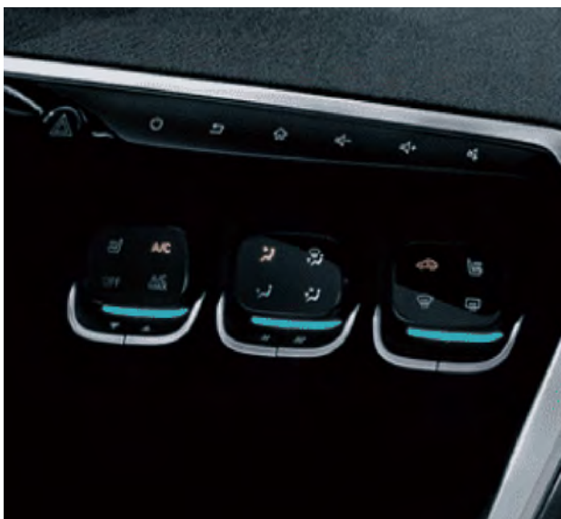
Elegancki panel sterowania systemem klimatyzacji