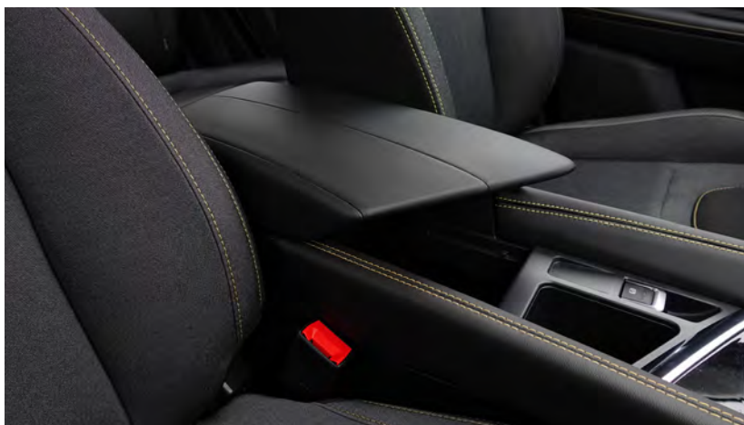
Elegancki i praktyczny podłokietnik ze schowkiem